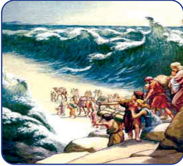
(انشقاق البحر وعبورُ سيِّدنا موسى ﷺ ومن آمنَ معه ونجَّاهم)