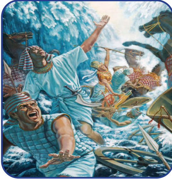
(غرقُ فرعون وجنوده)